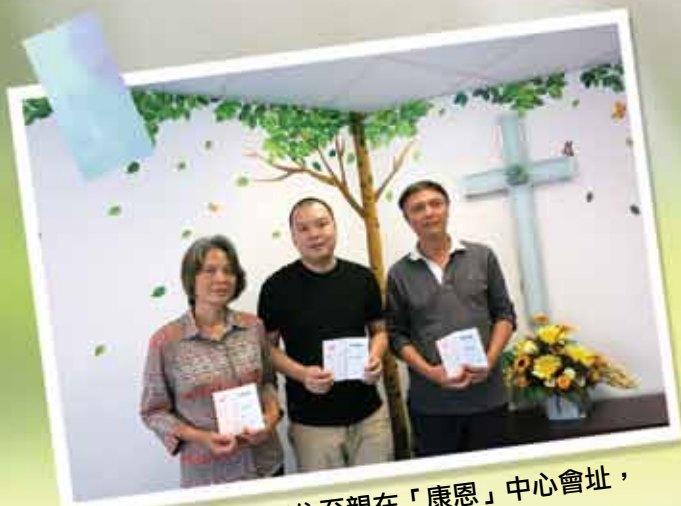
圖一 逝者的三位至親在「康恩」中心會址， 同一時間決志信主

謝謝大家繼續以禱告和金錢支持我們，深願神多多賜智慧與我們，為祂的國度忠心地擺上。